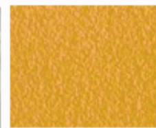
Superficie aumentata 100 veces

Superficie di stampa: Mescola resistente ai vari tipi di solventi di pulizia