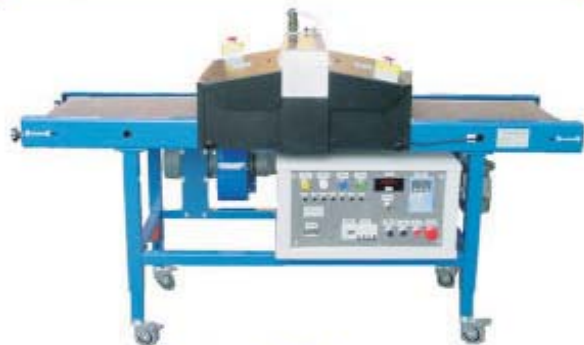
RotaryUV Mod. 380