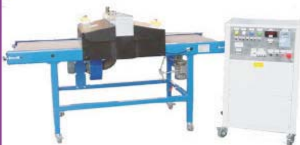
RotaryUV Mod. 520 - 750 - 1000